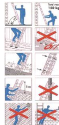
Betriebsanweisung für Anlegeleitern