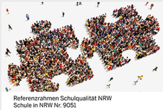
Referenzrahmen Schulqualität NRW Schule in NRW Nr. 9051

https://padlet.com/ 400regionalesbildungsbuero/ 5tpx4ed8actpt99l